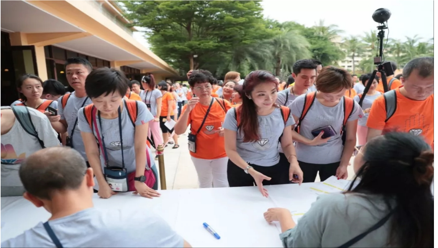
Registrierung für optionale Seminare