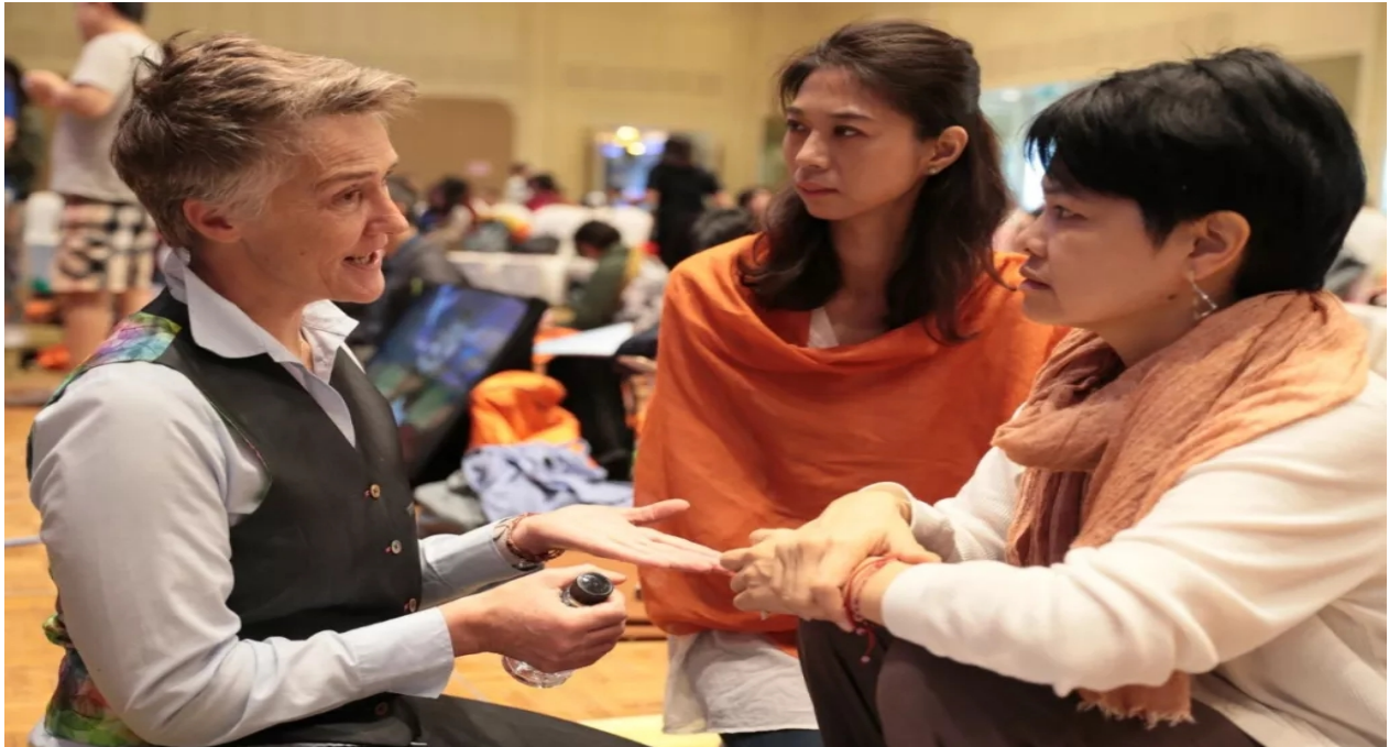
Q&A by ACI Lehrer während der Pausen

Hauptprogramm: Eröffnung, Geshe Michaels Teachings, optionale Seminare, Yoga-Sessions für unterschiedliche Level, Weisheitsgruppe, Feuer-Puja für den Weltfrieden, Abschlussfeier, usw.