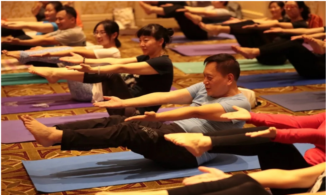
Große Anstrengung! Komm schon! Mach weiter!