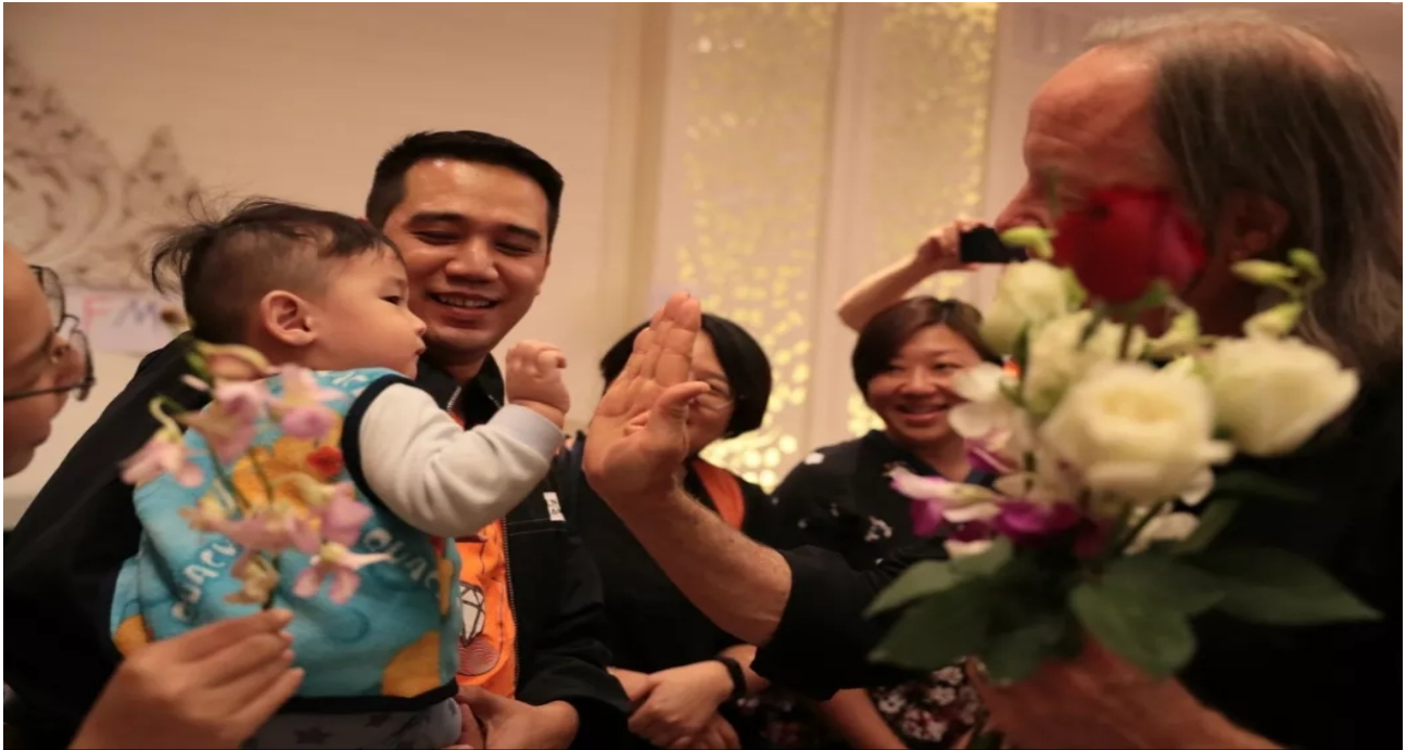
Das 2 Monate alte Baby