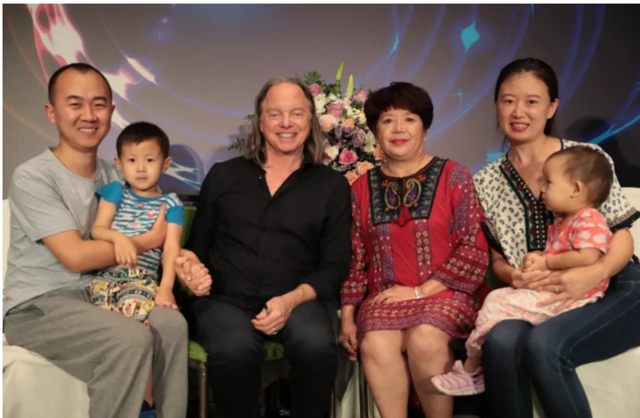
Du kommst und bringst deine Familie mit